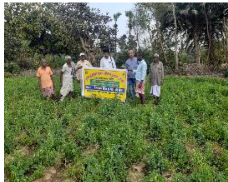
कृषक पाठशाला बरदेहिया, प्रखण्ड-मोहनपुर