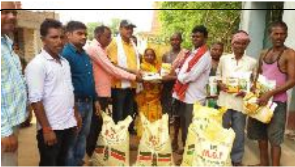
उपादान वितरण प्रखण्ड-मधुपुर