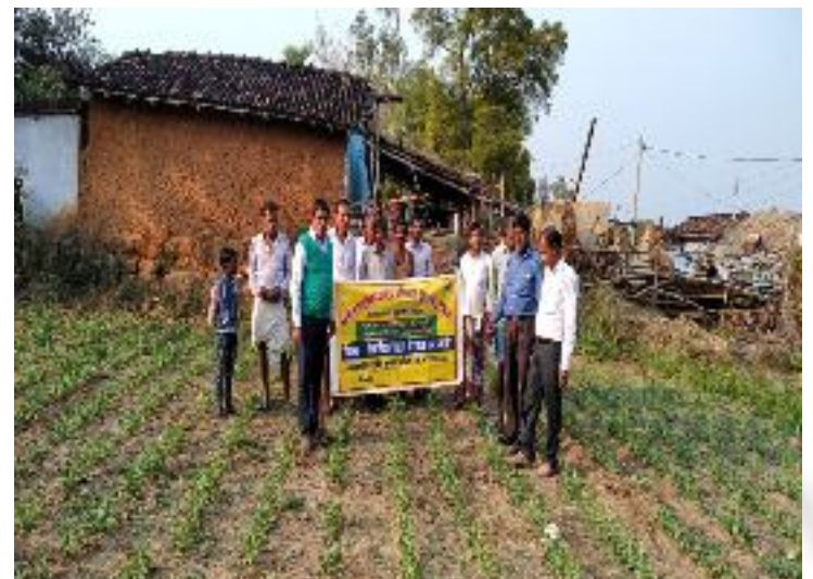
कृषक पाठशाला लोकपुर, प्रखण्ड-सारठ