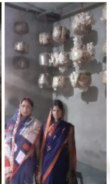
कृषक पाठशाला गोंदलवारी, प्रखण्ड-सारवाँ