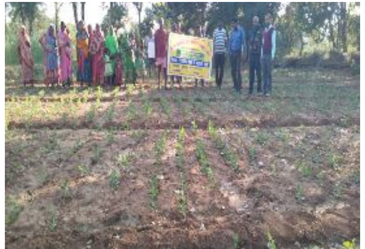
कृषक पाठशाला अम्बा, प्रखण्ड-पालोजोरी