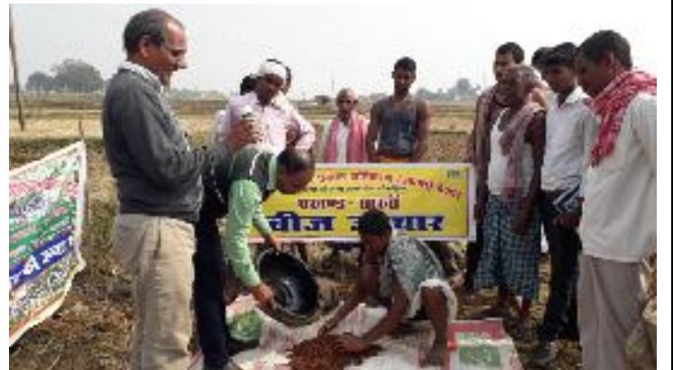
कृषक पाठशाला जीवडीह, प्रखण्ड-सारवाँ