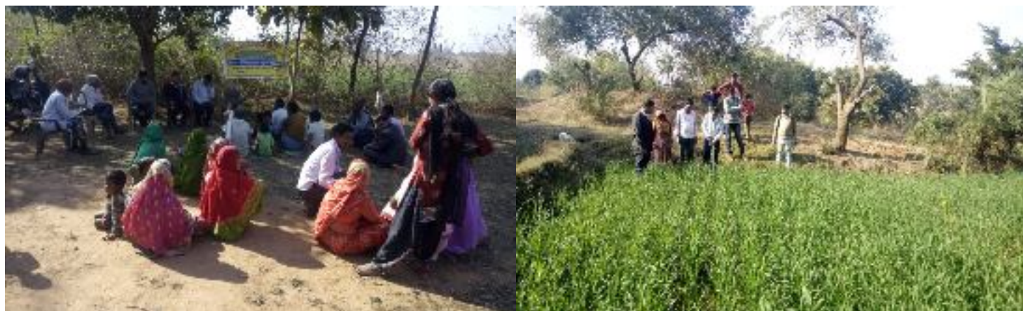
कृषक पाठशाला दुहोसुही, प्रखण्ड-देवीपुर