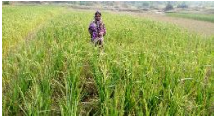
फिल्ड फोटो प्रखण्ड-देवीपुर