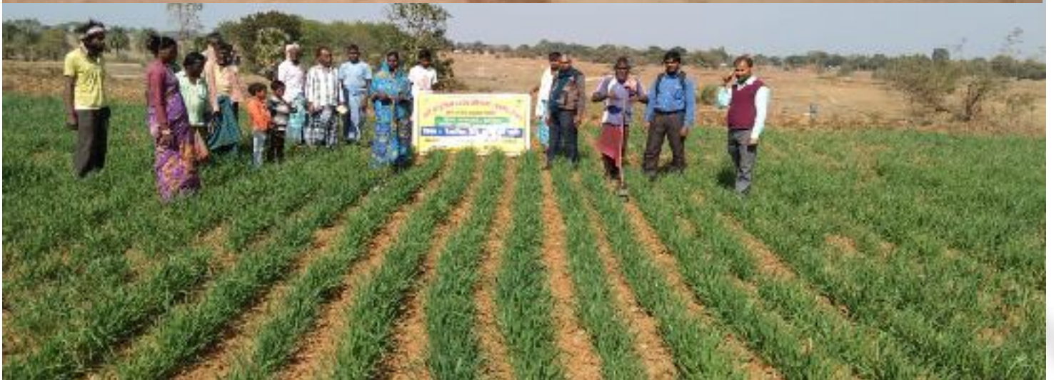
कृषक पाठशाला डुमरिया, प्रखण्ड-पालोजीरी