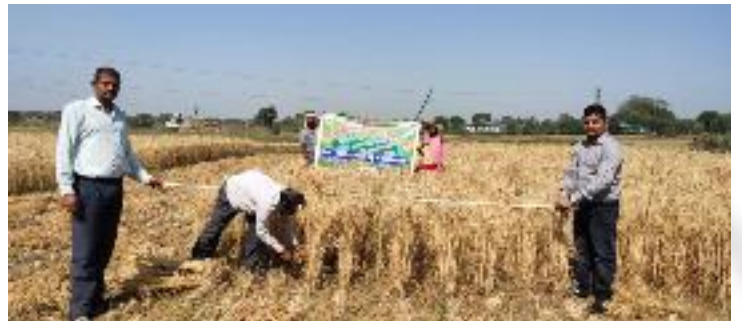
कृषक पाठशाला साप्तर, प्रखण्ड-मधुपुर