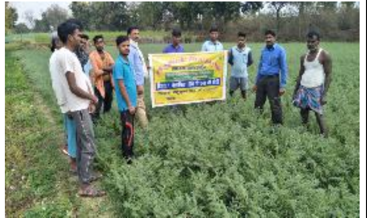
कृषक पाठशाला बड़ा धनतरिया, प्रखण्ड-करौं