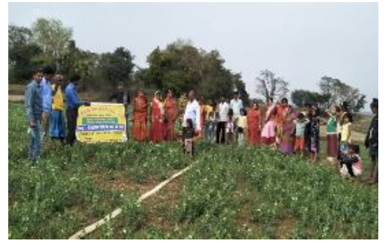
कृषक पाठशाला पथरा, प्रखण्ड-करौं