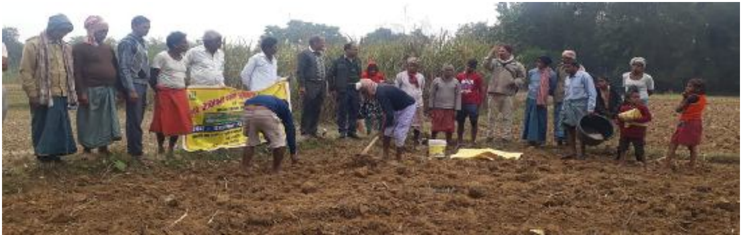
कृषक पाठशाला रमलडीह, प्रखण्ड-देवघर