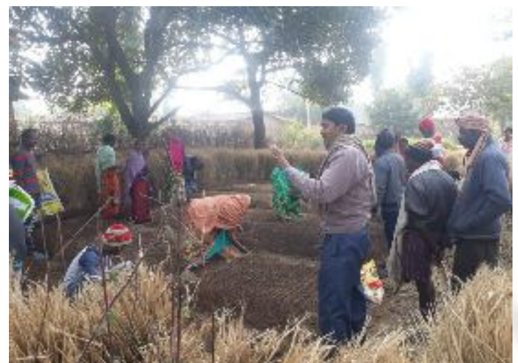
कृषक पाठशाला प्रतापपुर, प्रखण्ड-मारगौमुण्डा