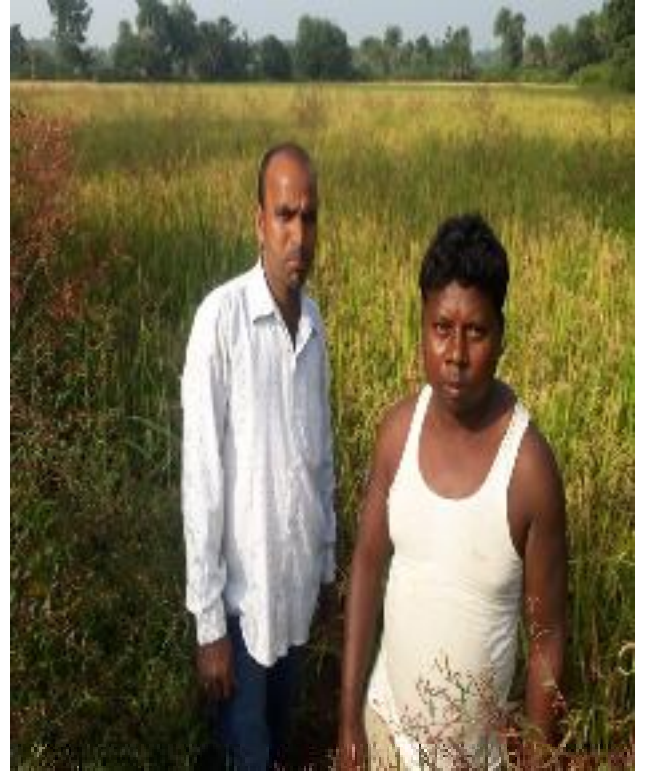
फिल्ड फोटो प्रखण्ड-मारगोमुण्डा