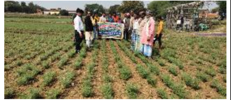
कृषक पाठशाला जामा, प्रखण्ड-मधुपुर