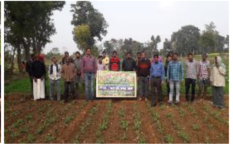
कृषक पाठशाला हेरलाडीह, प्रखण्ड-सारवाँ