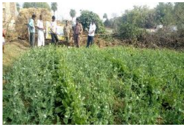
कृषक पाठशाला पहाड़तल्ली, प्रखण्ड-देवीपुर