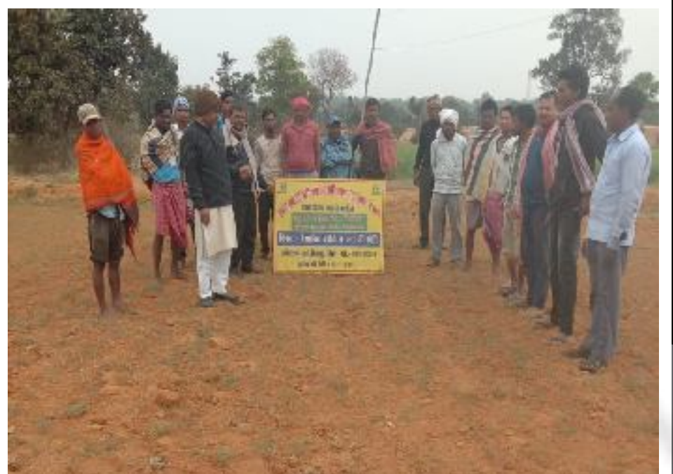
कृषक पाठशाला तिलौना, प्रखण्ड-सोनारायठाढ़ी