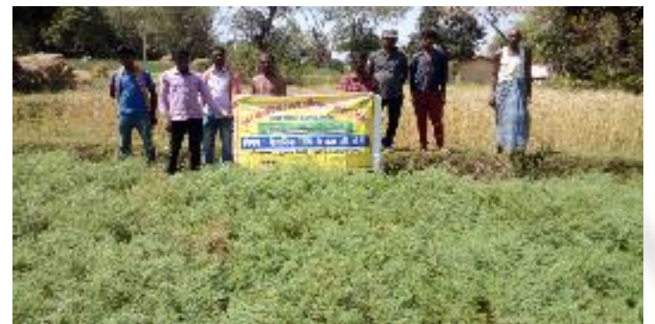
कृषक पाठशाला मदनपुर, प्रखण्ड-देवीपुर