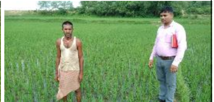
फिल्ड फोटो प्रखण्ड-मधुपुर