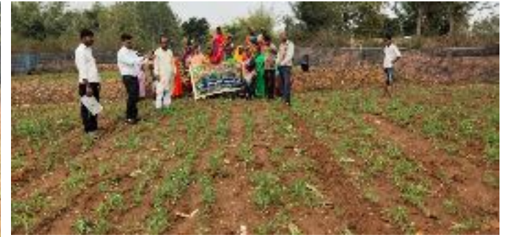
कृषक पाठशाला लहियाटांड, प्रखण्ड-मधुपुर