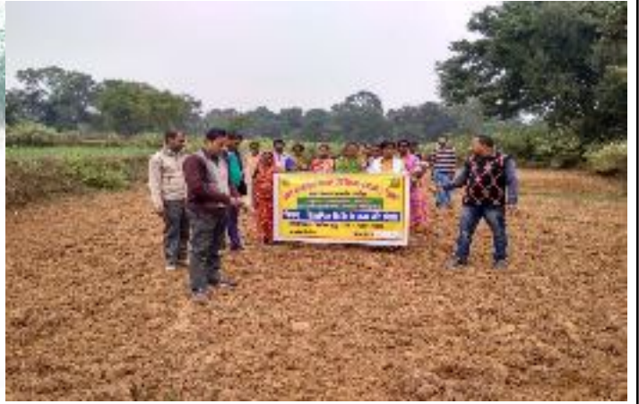
कृषक पाठशाला खैरवा, प्रखण्ड-पालीजोरी