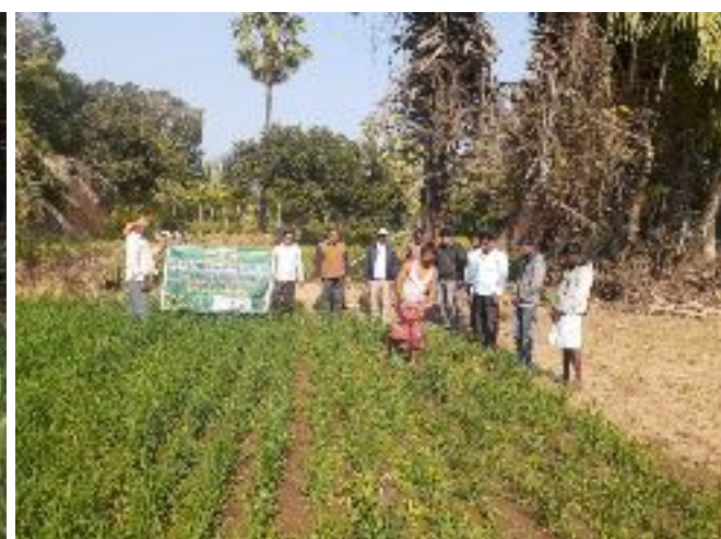
कृषक पाठशाला तीरनगर, प्रखण्ड-मोहनपुर