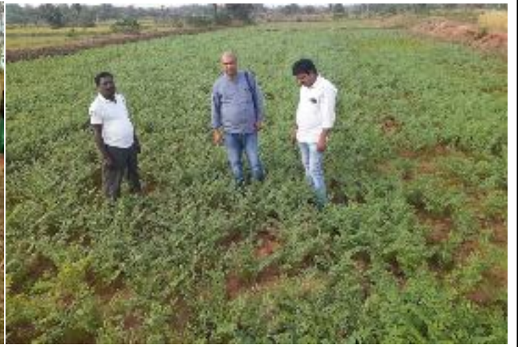
कृषक पाठशाला खपचवा, प्रखण्ड-मोहनपुर