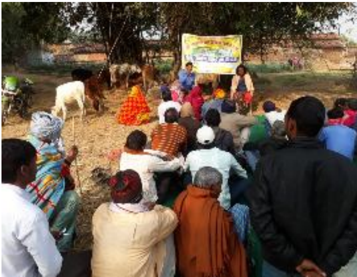
कृषक पाठशाला भंडारी, प्रखण्ड-मारगौमुण्डा