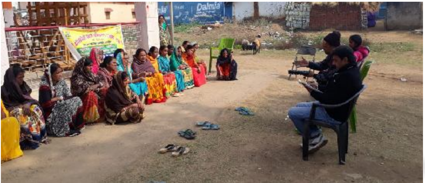
कृषक पाठशाला सरसा, प्रखण्ड-देवघर