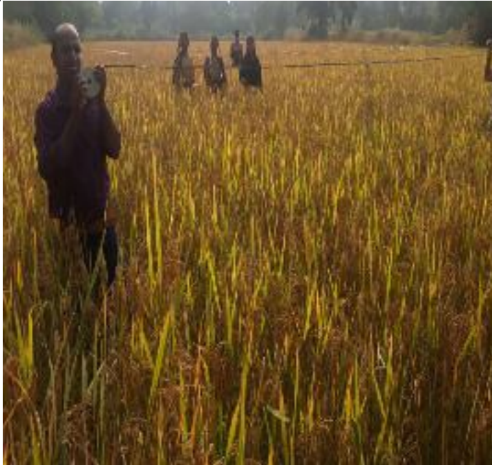
फसल कटनी फोटो, प्रखण्ड-मारगोमुण्डा