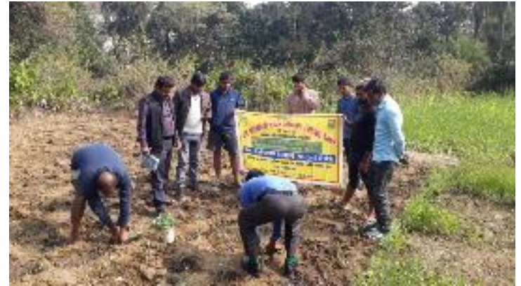
कृषक पाठशाला टाभाघाट, प्रखण्ड-देवघर