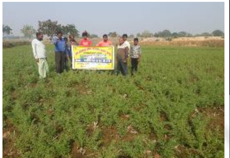
कृषक पाठशाला चिकनियाँ, प्रखण्ड-मारगोमुण्डा