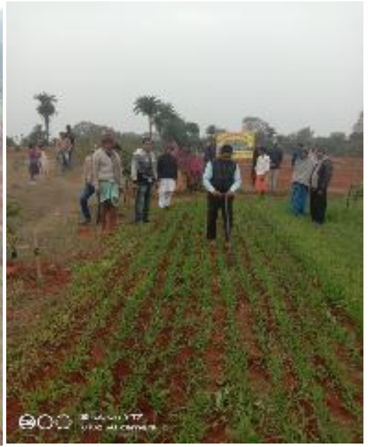
कृषक पाठशाला घनवेपुराना, प्रखण्ड-सीनारायखड़ी