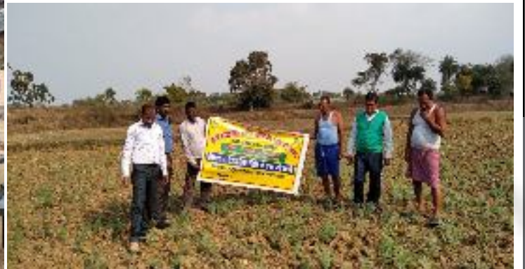
कृषक पाठशाला ब्रहमसोली, प्रखण्ड-सारठ