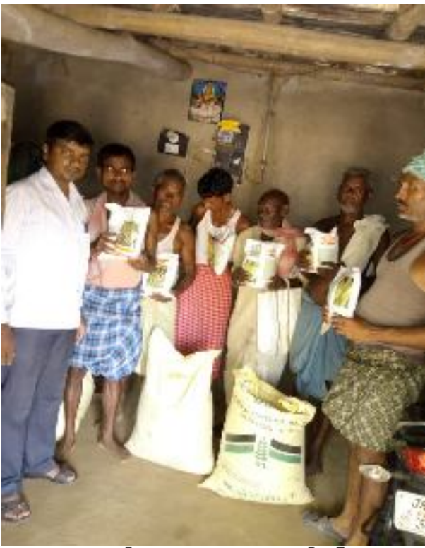
उपादान वितरण प्रखण्ड-देवीपुर