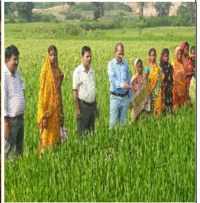
प्रखण्ड-मोहनपुर, प्रत्यक्षण निरीक्षण