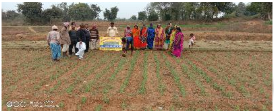
कृषक पाठशाला दशमोरिया, प्रखण्ड-सोनारायठाड़ी