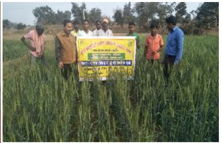
कृषक पाठशाला धोवना, प्रखण्ड-करौं